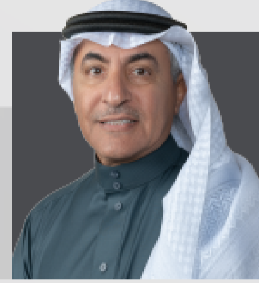
معالي الأستاذ/ حمد بن محمد الضويلع